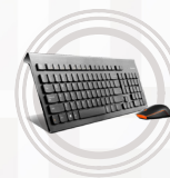
Lenovo Professional Wireless-Kombination