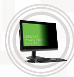
Lenovo Blickschutzfilter von 3M für ThinkCentre AIO