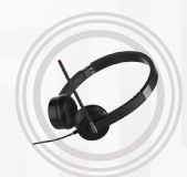
Lenovo Stereo- Headset