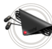
ThinkPad® X1 In-Ohr-Kopfhörer

Exzellente Soundqualität und hoher Tragekomfort