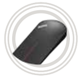
ThinkPad® X1 Wireless-Touch-Maus

Drahtlos verbinden und neue Funktionen mit Ihrem Gerät nutzen